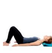
Asanas im Liegen und Sitzen