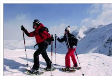
Wanderfreuden im Schnee mit den 19 Vitalpina Hotels Südtirol erleben.

Tourismus, Auto & Verkehr Pressemitteilung von: Vitalpina Hotels Südtirol ▶ PR Agentur: häberlein & mauerer